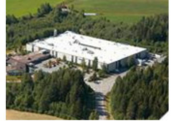
Finlandiya Vihtavuori'deki Ecocat genel merkezi ve üretim tesisi.

Komple egzoz sistemlerinin dünya çapındaki üreticisi Danimarka kökenli Dinex, Finlandiya kökenli Ecocat'ı bünyesine katarak yeni teknolojilerle birlikte portfolyosuna bir uzmanlık daha eklemektedir. Dinex grubun sahibi ve CEO'su Torben Dinesen, "Ecocat ve Dinex'in son 10 yılda birçok teknolojiye ve müşteri projelerinde birlikte çalıştığını ve iki şirketi birleştirmede büyük fırsatlar gördük" dedi.