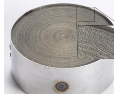
Ecocat tarafından üretilen ve kaplanan metal dizel oksidasyon katalisti.

Torben Dinesen "Önemli bir adım attık ve Dinex için gelecekte eşsiz bir konum yarattık" diye konuştu. "Konsolide olarak biz, daha fazla deneyim, daha fazla teknolojiye sahip bir grup olacağız ve pazarda müşterilerimiz açısından daha iyi bir konumda yer alacağız. Müşterilerimizin 8 farklı tedarikçiden sorgulayabilecekleri bir ürün yelpazesi ve hizmet sunmaktayız".