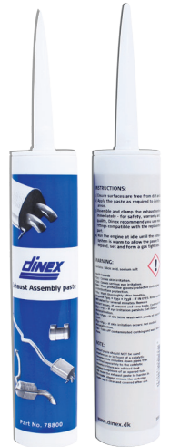
Dinex Nr. 78800 Dinex Abgas-Montagepaste