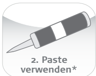
2. Paste verwenden*

1. Trennen sie das Rohr so nah wie möglich beim Flexeteil ab. Der Abstand zur Montagehalterung muss min. 76mm betragen.