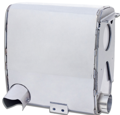
Dinex no. 47333 OE no. 81.15103.6037 Dinex no. 47335 81.15103.0039 OE no. 81.15103.6038