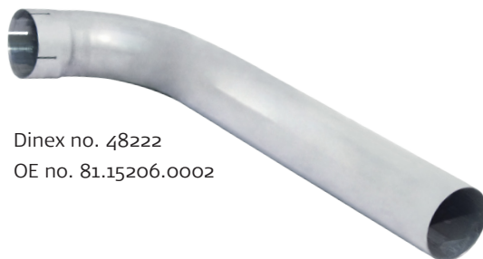
Dinex no. 48222 OE no. 81.15206.0002