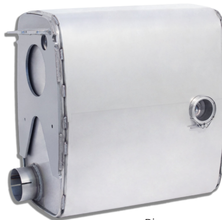
Dinex no. 47340 Dinex no. 47330 OE no. 81.15103.0094 OE no. 81.15103.0026 81.15103.6059 81.15103.0035